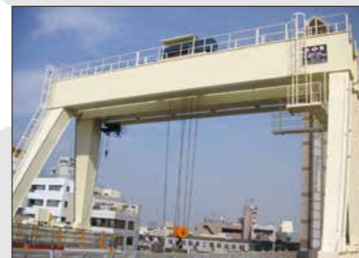
クラブトロリ式橋形クレーン