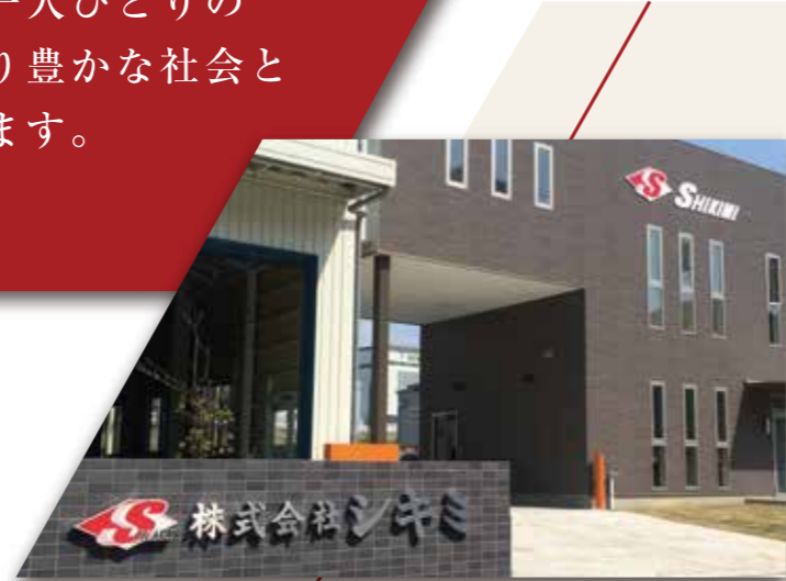
2014年5月新設 シキミ大府工場