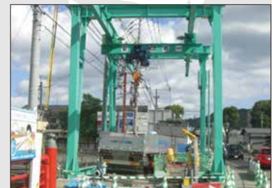
サスペンション式天井クレーン