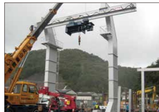
ホイスト式橋形クレーン