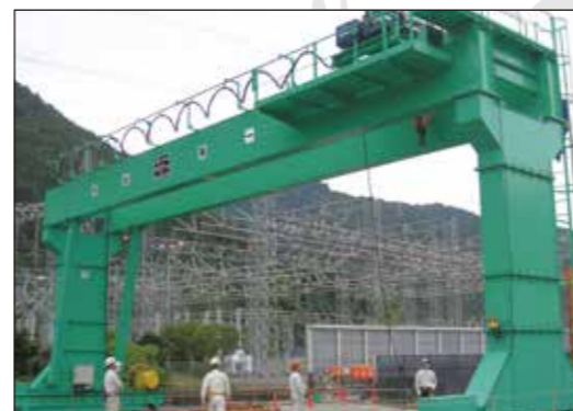
クラブトロリ式橋形クレーン